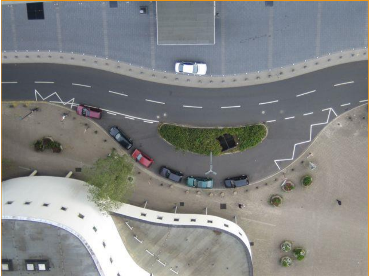
Warteplätze am Vorplatz Dreischeibenhaus