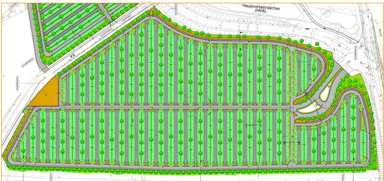
Lageplan Parkplatz P6